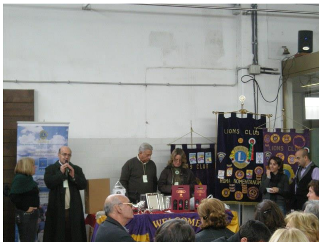
Cantine di Villafranca